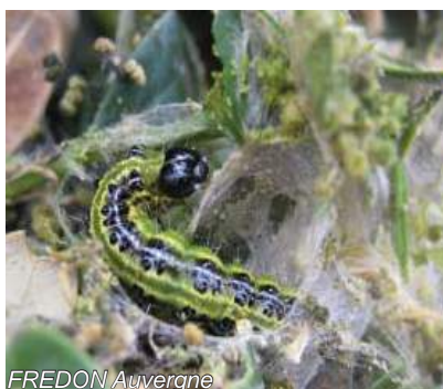
Chenille de la pyrale du buis dans son cocon.

Sur la commune du Puy-en-Velay (43), aucune détection de chenilles, ni présence de dégâts.