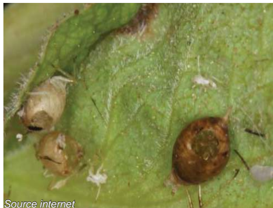
Momies de pucerons, parasitées par l'auxiliaire