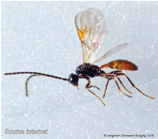
Adultes d'Aphidius ou Lysiphlebus.

Pour rappel, cet auxiliaire pond ses œufs à l'intérieur du puceron et le vide de son contenu comme observé sur la photo (ci-dessous).