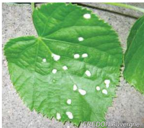
Symptômes causés par les phytophtes sur feuilles de tilleul.

Ces déformations ne sont pas très préjudiciables pour l'arbre, l'aspect esthétique est uniquement fortement dégradé.