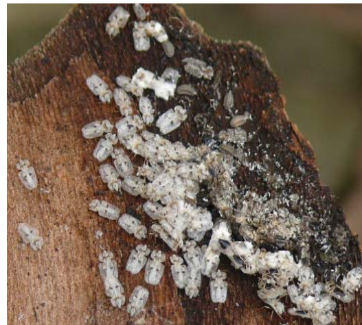
Tigres du platane sous rhytidomes.